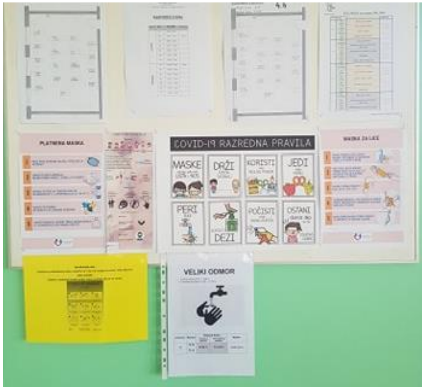
Protokoli i preventivni plakati u razrednim učionicama