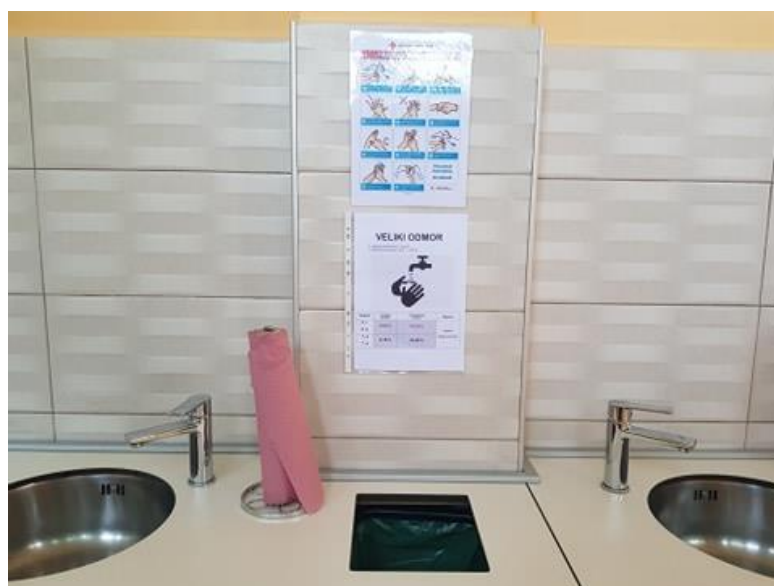
Raspored i upute za pravilno pranje ruku