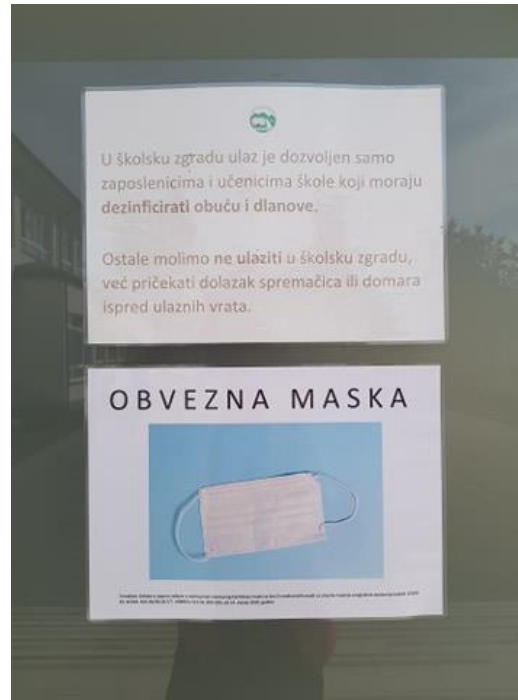
Obavezna dezinfekcija kod ulaska u školsku zgradu i nošenje maske