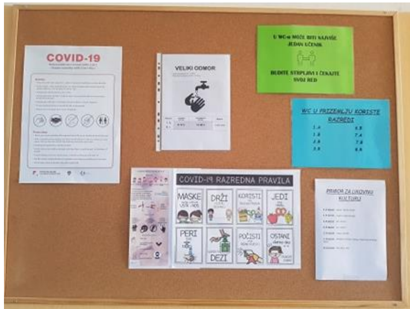
Preventivni plakati i raspored razreda za korištenje toaleta i pranje ruku