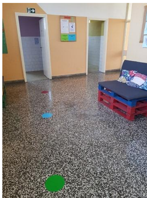
Oznake za održavanje propisanog razmaka