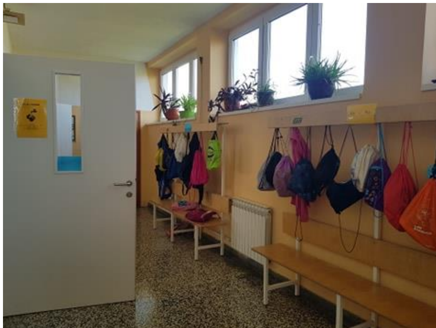
Raspored pranja ruku te oznake razreda na razrednim vješalicama