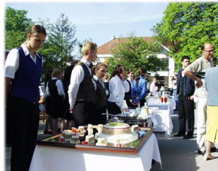
„Mali Gastro“ – humanitarna akcija

Regionalni centar kompetencija u turizmu i ugostiteljstvu