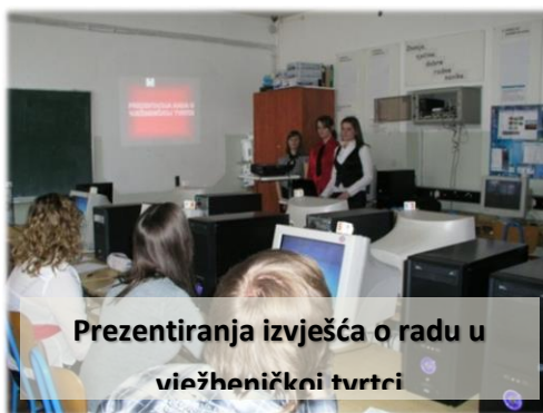
Prezentiranja izvješća o radu u vježbeničkoj tvrtci

Opseg poslova i radni zadaci ovise o veličini tvrtke, odnosno organizacije u kojoj ekonomist radi. Ekonomist se specijalizira za određene djelatnosti (trgovina, ugostiteljstvo, proizvodnja, usluge).