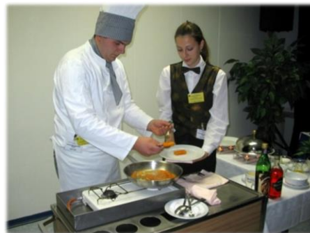
Turističko-hotelijerski komercijalisti - Flambiranje delicia