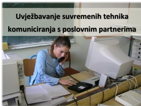
Uvježbavanje suvremenih tehnika komuniciranja s poslovnim partnerima